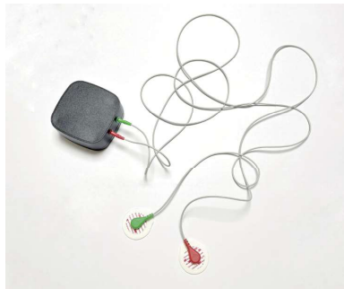
심박변이도 측정기 예시