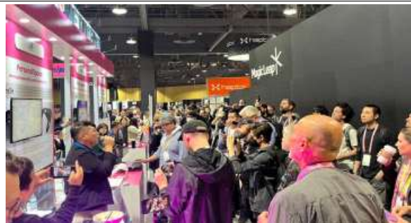
AWE USA 전시 현장(보도 등 사진 발췌)